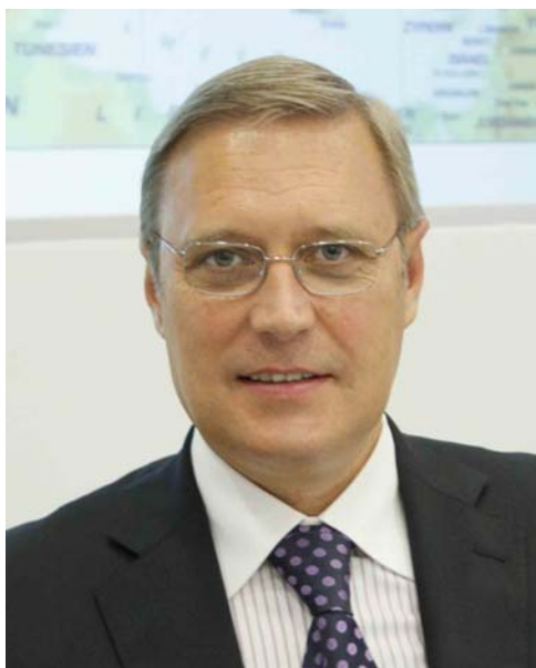
Michail Kasjanow, Russlands ehemaliger Ministerpräsident, war der interessanteste Redner bei der Nürnberger Sicherheitstagung. Sein Vortrag wurde mit viel Spannung erwartet.