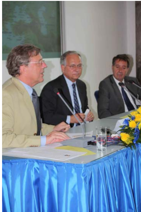
Wolfgang Ischinger auf dem Podium zwischen den Moderatoren Braun und Trost

nun weiter entwickelt, ist nach Ischinger zur Zeit offen, obwohl die NATO-Vertreter einschließlich des deutschen Außenministers Frank-Walter Steinmeier am selben Tag bei der NATO-Russland-Konferenz in Korfu wieder Gesprächsbereitschaft zeigten. Wie soll aber das Problem der Raketenstationierung in Polen und Tschechien ohne Gesichtsverlust dieser beiden Länder gelöst werden, ohne sie „den Russen zum Fraß vorzuwerfen“?