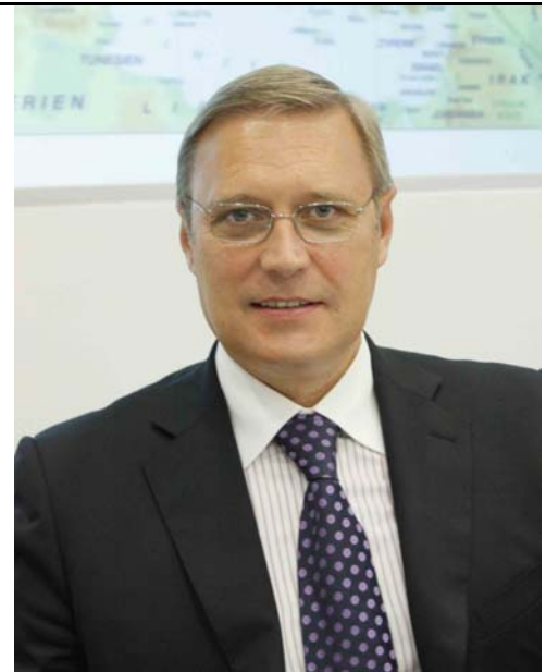
Michail Kasjanow war vom Mai 1999 bis 2000 russischer Finanzminister, vom Mai 2000 bis Februar 2004 Premierminister von Russland. Von Putin wegen zu großer Liberalität entlassen, gründete er im Juni 2007 die oppositionelle Partei „Das Volk für Demokratie und Gerechtigkeit“.

Die wahren Interessen des Landes hätte das Regime um Medwedew und Putin nicht im Sinn. Die staatlichen Mittel würden für Dinge eingesetzt, die nicht nachhaltig und weittragend sind, so etwa für Propaganda und den Geheim-