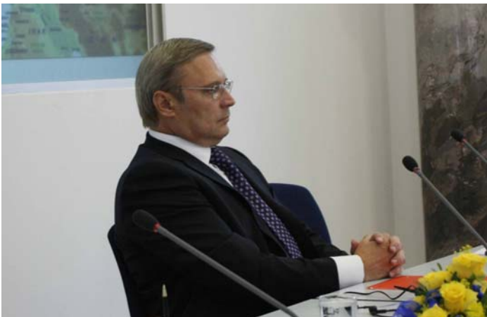
Kasjanow wartet auf seinen Einsatz als Redner.

Russland sei sehr an tragfähigen wirtschaftlichen und politischen Fortschritten interessiert, beantwortete der Premierminister a.D. die erste Frage. Zu den russischen Interessen gehören offenbar auch die militärischen Interventionen im Ausland. Nationale Integrität erkenne Russland nicht an, was zu Ängsten vor diesem Land geführt und es zu einer Quelle der Instabilität gemacht habe. Das habe die Beziehungen zur NATO jetzt beeinträchtigt, denn die Positionen Russlands seien nicht konform mit denen des Nordatlantischen Bündnisses. Die Zusammenarbeit seit 2003 habe nicht sehr weit geführt, weil Russland in Fällen von Kontroversen nichts zur Lösung beigetragen habe. So setze sich auch die gefährliche Konfliktlage mit Georgien fort.