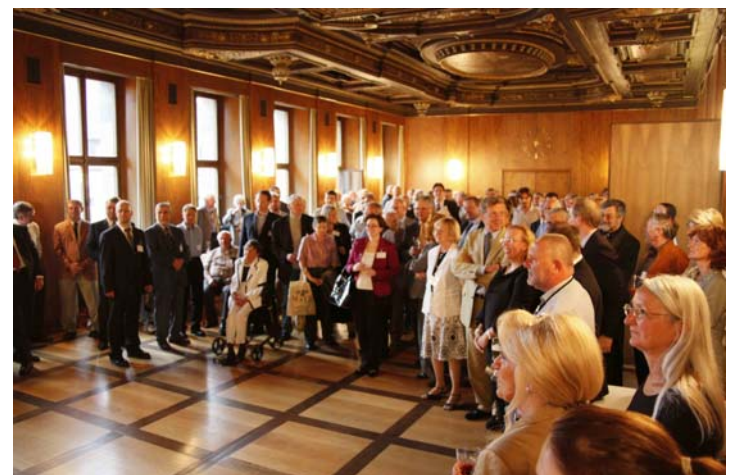
Rechts: Die Tagungsteilnehmer lauschen den Worten von Bürgermeister Horst Förther im Alten Rathaus.