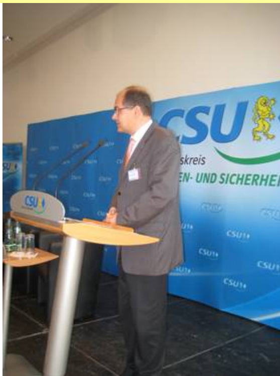
Christian Schmidt, der Landesvorsitzende des ASP und Staatssekretär im Bundesministerium der Verteidigung, bei seiner Grundsatzrede in Weiden

Der Außen- und Sicherheitspolitische Arbeitskreis, sagte Christian Schmidt, will sich in diesem Sinn in die bayerische, deutsche und europäische Politik einbringen, und von Weiden solle ein selbstbewusstes Signal ausgehen: nicht den Konflikt suchen, aber ihm auch nicht unbedingt aus dem Weg gehen.