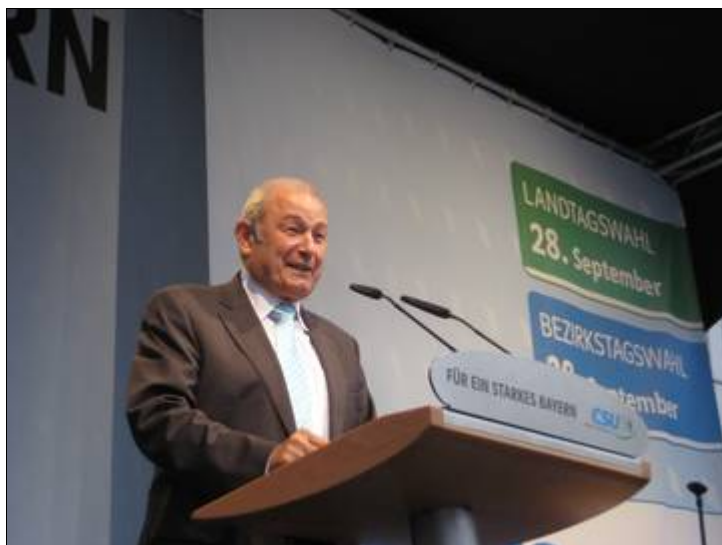
Der damalige bayerische Ministerpräsident Günther Beckstein bei seiner Rede zur Wahlkampf-Abschlusskundgebung der CSU in Würzburg am 23.09.2008

Die Ohren klingelten einem, die Medien überboten sich mit ihren Sensationsmeldungen und giftig-befriedigten Kommentaren. Man konnte es nicht schon mehr hören: Die CSU hatte bei den Landtagswahlen am 28. September 2008 eine "erdbebenartige" Wahlschlappe erlitten. Hinter den Bewertungen des Wahlausgangs durch die Kommentatoren verbarg sich kaum noch verhüllt Genugtuung und Hämme.