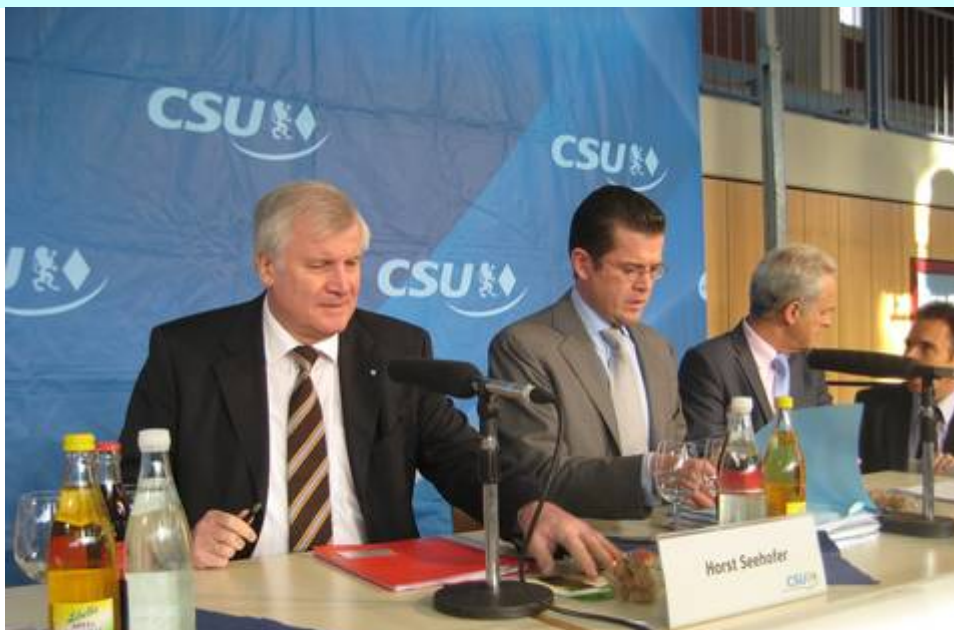
Horst Seehofer mit seinem Generalsekretär Karl-Theodor zu Guttenberg auf dem Podium. Rechts daneben Dr. Peter Ramsauer (MdB), Vorsitz. d. Landesgrp. im Bundestag

Seehofer wurde dann deutlicher, welche Akzente die bayerische Politik im Land und im Bund setzen will: Der Bürger soll einen deutlicheren Anteil am erzielten Mehrgewinn bekommen, und mit der steuerlichen Entlastung solle noch vor den Bundestagswahlen begonnen werden. Für die Neuregelung der Erbschaftssteuer forderte er, erst einmal mit der CDU klar zu kommen und dann sich mit der SPD in der Regierungskoalition auseinanderzusetzen. Das bayerische Investitionsprogramm solle auch in beschleunigten Verfahren in den Haushaltsausschüssen und in den Regierungsbezirken weiter gegeben werden, z. B. für die lückenlose Installation der neuen Internet-Übertragungstechniken.